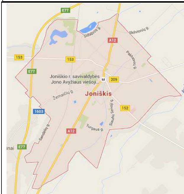
1 pav. Joniškio miesto teritorijos ribos.

Joniškio miestas – Joniškio rajono savivaldybės centras. Miesto teritorija yra nedidelė, užima 895 ha plotą (Joniškio rajono savivaldybės plotas – 115 200 ha).